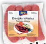
Aro kranjska kobasica 320 g