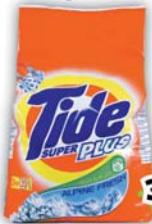
Tide deterdžent za pranje rublja, više vrsta 2 kg